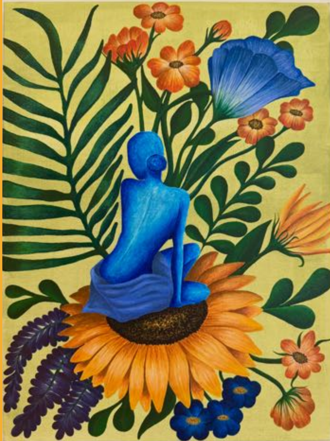
ACRYL AUF LEINWAND