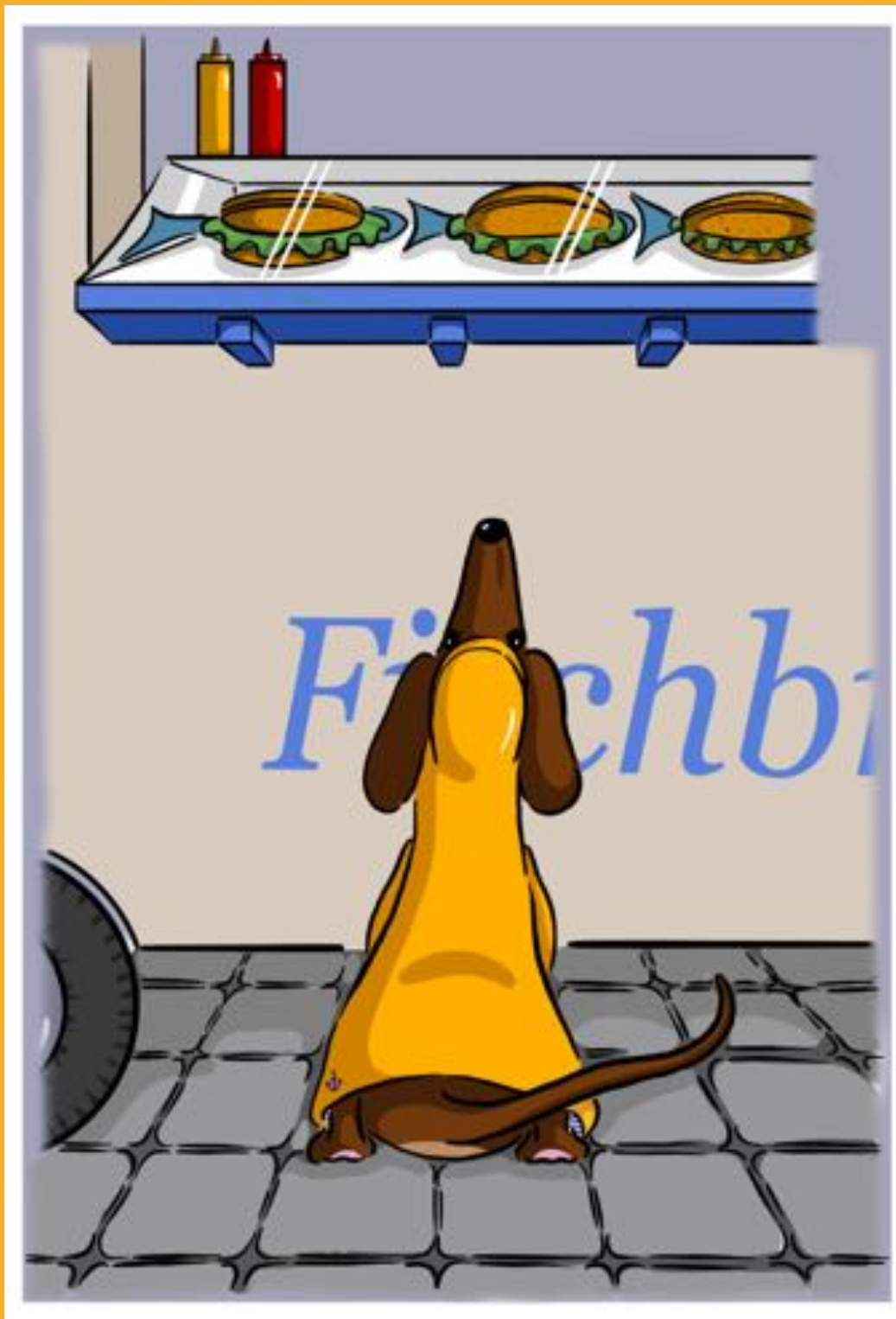
ANGEKOMMEN BEI DEN LANDUNGSBRÜCKEN BESORGT ER SICH SEIN FISCHBRÖTCHEN