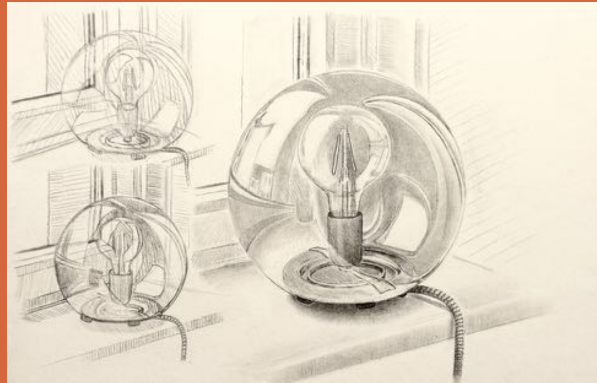
BLEISTIFT AUF ZEICHENKARTON