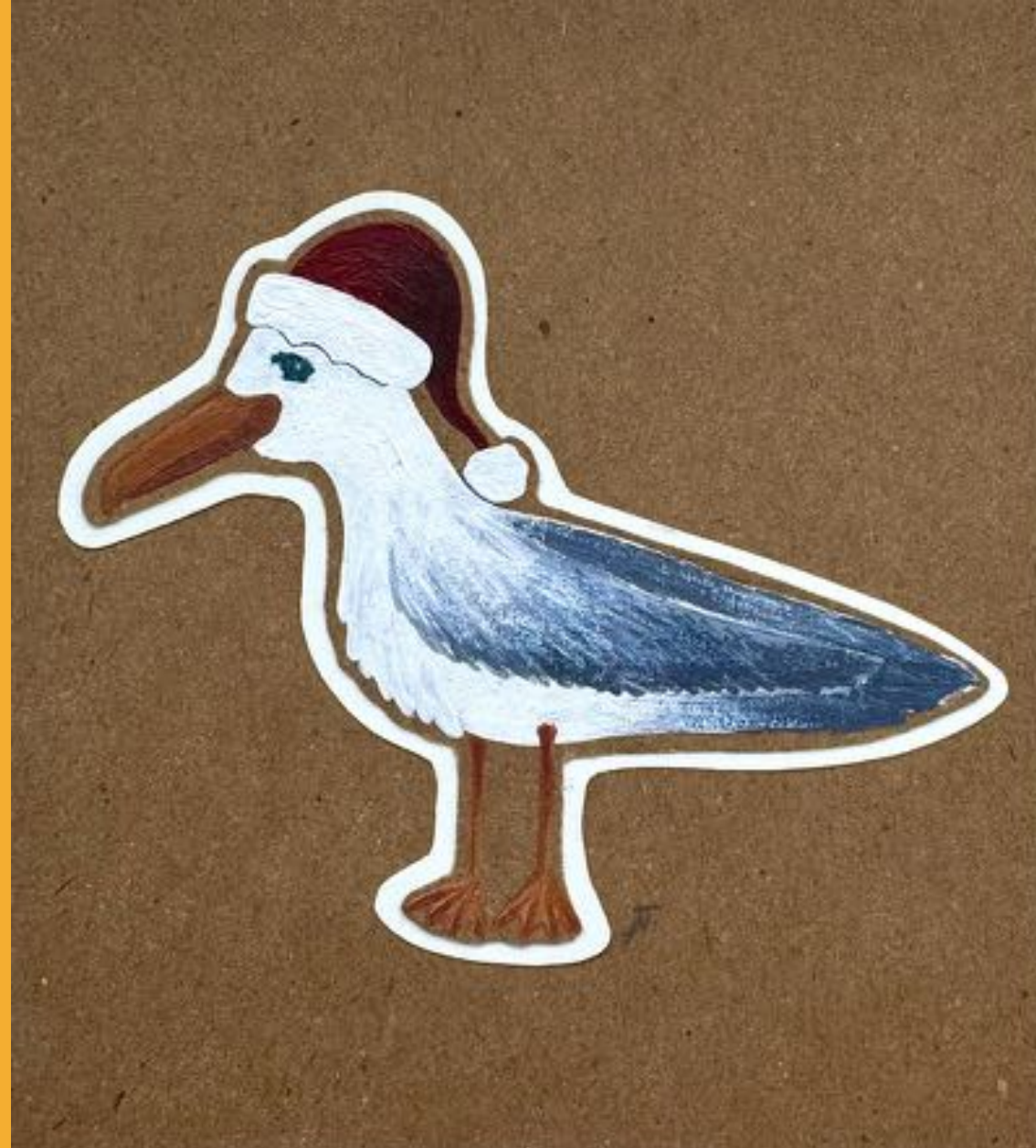
ACRYL AUF KARTON