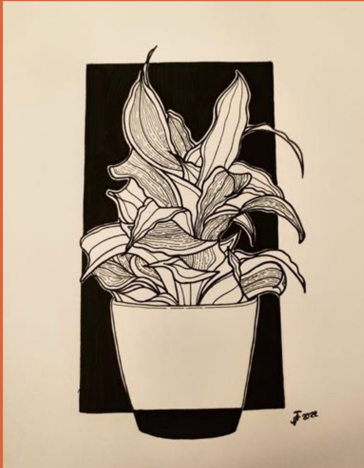
FINELINER AUF ZEICHENKARTON