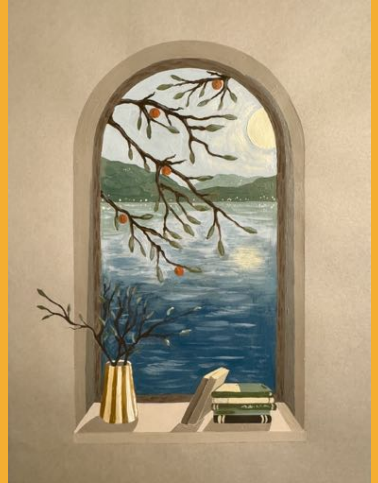
ACRYL AUF KARTON